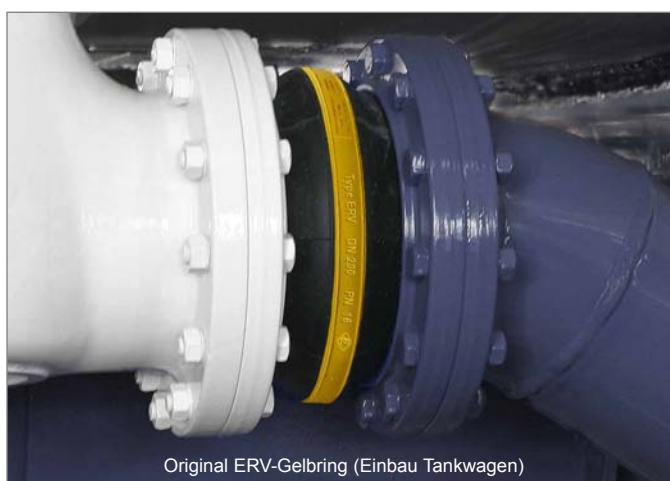
Original ERV-Gelbring (Einbau Tankwagen)

Mittlerweile wird aber leider auch die Art der Kennzeichnung, in Form eines umlaufenden Ringes, kopiert. Wir weisen darauf hin, dass z. B. nicht überall ein treibstoffbeständiger Gummi "drin ist", wo ein gelber Ring "drauf ist".