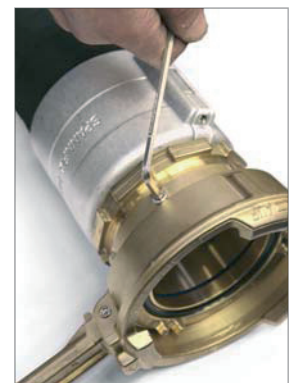
Gewindefixierung mit Sechskantschlüssel EW - SK 5