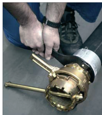
Montage: Gelenkhakenschlüssel EW-GH 90/155 und Kupplungsschlüssel

Forged (hot stamped) quality according to EN 14420-6, single-handed operation, same seals. Part number and price remain unchanged.